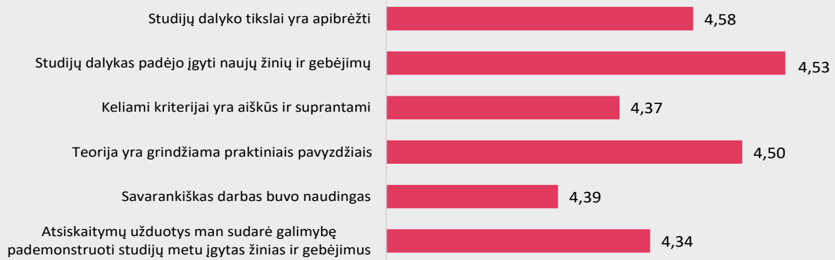
1 pav. Skubiosios medicinos pagalbos studijų programos dalykų turinio kokybės vertinimas pagal kriterijus (vidurkiai).

Pastaba: Pateiktas „Likerto“ skalės vidurkis.