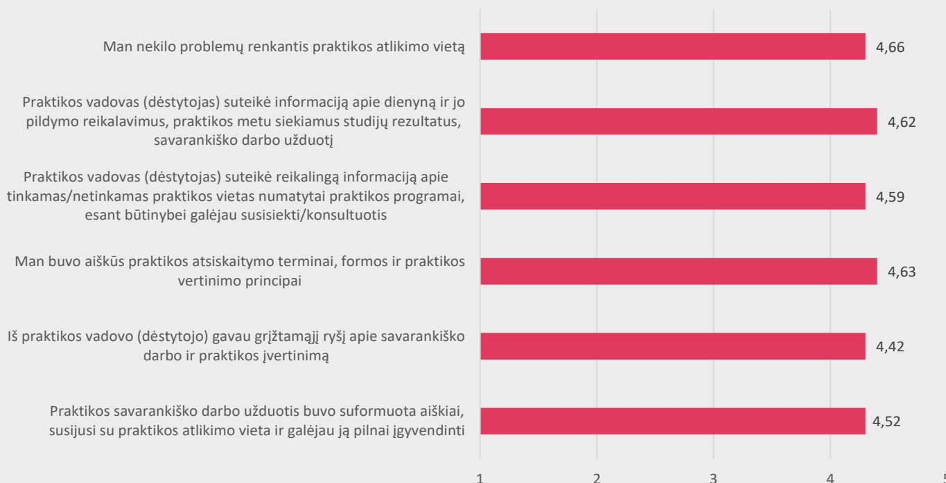
1 pav. Medicinos fakulteto studentų nuomonė apie profesinės veiklos praktikos organizavimą

APKLAUSOS REZULTATAI: Apklausoje iš viso buvo užpildytos 417 anketos, kurias pildė 2025-2026 m. m. rudens semestrą praktiką atlikę Medicinos fakulteto studentai: Akušerijos 58 (13,9 proc.), Bendrosios praktikos slaugos 168 (40,3 proc.), Skubiosios medicinos pagalbos 11 (2,6 proc.), Burnos higienos 26 (6,2 proc.), Dantų technologijos 17 (4,1 proc.), Dietetikos-, Kineziterapijos 47 (11,3 proc.), Kosmetologijos 52 (12,5 proc.), Odontologinės priežiūros 38 (9,1 proc.). Bendrai studentai praktikų organizavimo kokybę vertina 10 balų - 249 studentų (59,7 proc.), 9 balais - 95 (22,8 proc.), 8 balais- 49 (11,8 proc.), 7 balais 14 (3,4 proc.), 6 balais 4 (1proc.), 5 balais 1 (0,2 proc.), 4 balais 3 (0,7proc.), 3 balais 0 ( 0proc.), 2 balais 1 (0,2 proc.), 1 balas (0,2 proc.). Studentams buvo pateikti teiginiai apie praktikų organizavimą. Atlikus gautų duomenų analizę paaiškėjo, jog didžioji dalis studentų visiškai sutinka su pateiktais teiginiais apie praktikos organizavimą (žr. 1 pav.).