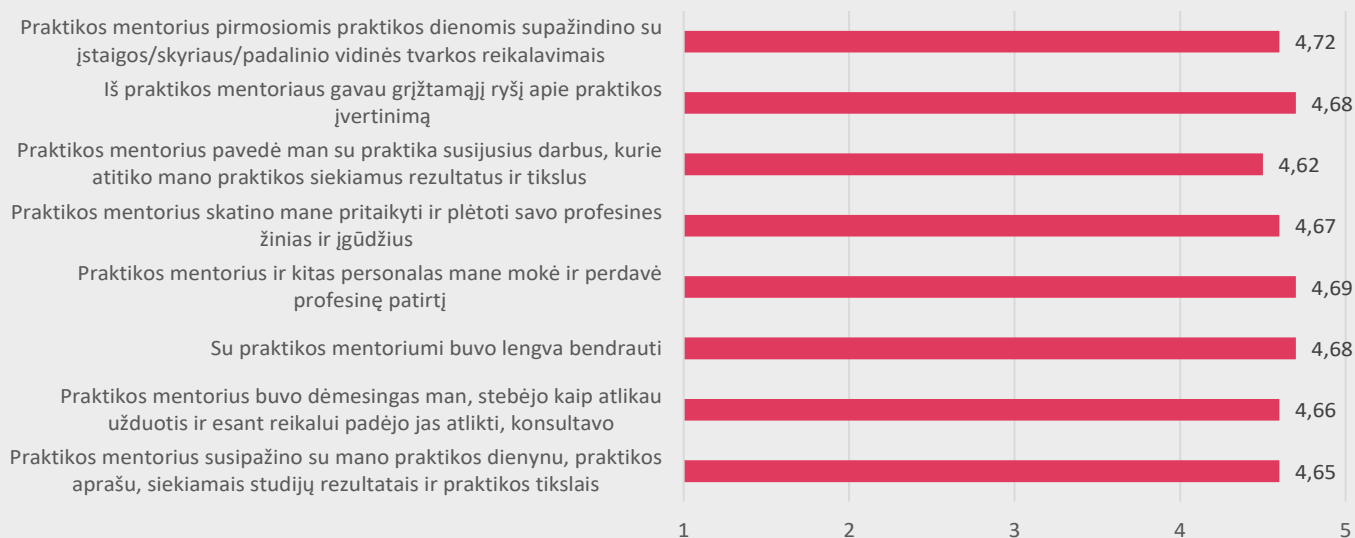
2 pav. Medicinos fakulteto studentų nuomonė apie praktikos mentoriaus vaidmenį praktikos metu

Studentams buvo pateikti teiginiai apie praktikos mentoriaus vaidmenį praktikos metu (žr. 2 pav.).