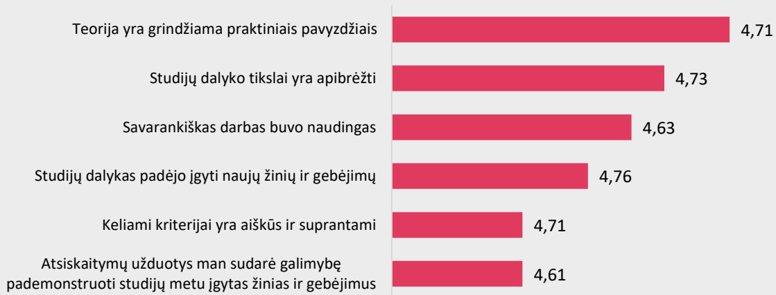
1 pav. Akušerijos studijų programos dalykų turinio kokybės vertinimas pagal kriterijus (vidurkiai).

Pastaba: Pateiktas „Likerto“ skalės vidurkis.