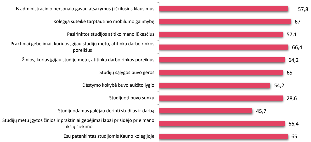
3 pav. Medicinos fakulteto absolventų nuomonė apie studijas Kauno kolegijoje (n=140)

Gautų duomenų analizė atskleidė, jog respondentai labiausiai sutinka su teiginiu, jog žinios ir praktiniai gebėjimai, kuriuos įgijo studijų metu, atitinka darbo rinkos poreikius (66,4 proc.), mažiausiai respondentai sutinka su teiginiu, jog studijas galėjo derinti su darbu (45,7 proc.). (žr. 3 pav.)