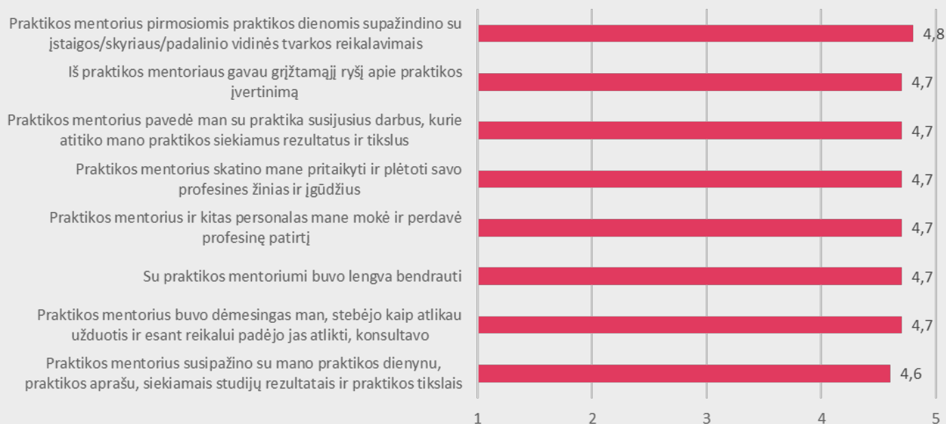
2 pav. Medicinos fakulteto studentų nuomonė apie praktikos mentoriaus vaidmenį praktikos metu

Studentams buvo pateikti teiginiai apie praktikos mentoriaus vaidmenį praktikos metu. Didžioji dalis studentų taip pat visiškai sutinka su visais pateiktais teiginiais (žr. 2 pav.).