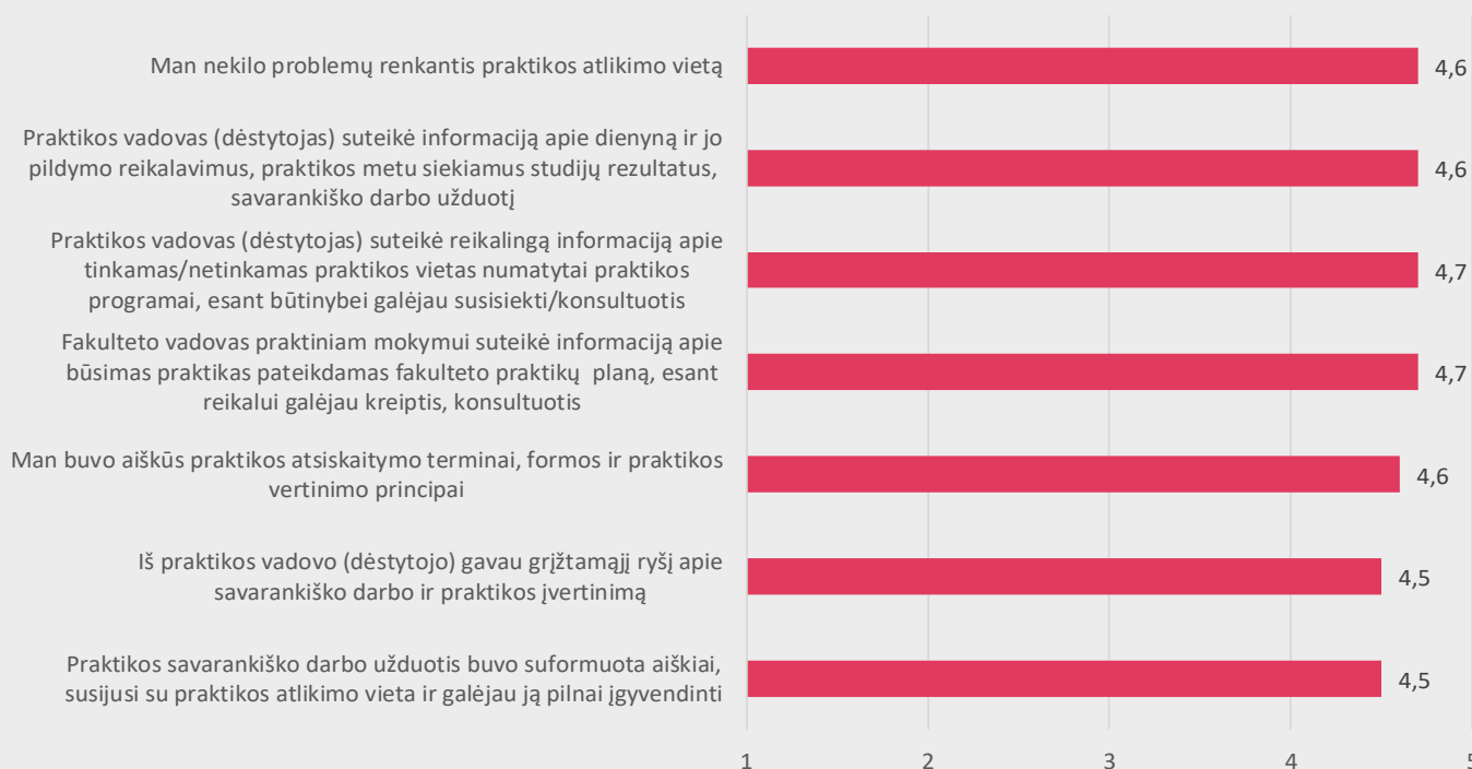
1 pav. Medicinos fakulteto studentų nuomonė apie profesinės veiklos praktikos organizavimą

APKLAUSOS REZULTATAI: Apklausoje iš viso buvo užpildytos 1131 anketos, kurias pildė 2023-2024 m. m. pavasario semestrą praktiką atlikę Medicinos fakulteto studentai (Akušerijos, Bendrosios praktikos slaugos, Biomedicinos diagnostikos, Burnos higienos, Dantų technologijos, Dietetikos, Ergoterapijos, Kineziterapijos, Kosmetologijos, Odontologinės priežiūros, Radiologijos studijų programų studentai). Bendrai studentai praktikų organizavimo kokybę vertina labai gerai (9,1 balo). Studentams buvo pateikti teiginiai apie praktikų organizavimą. Atlikus gautų duomenų analizę paaiškėjo, jog didžioji dalis studentų visiškai sutinka su pateiktais teiginiais apie praktikos organizavimą (žr. 1 pav.).