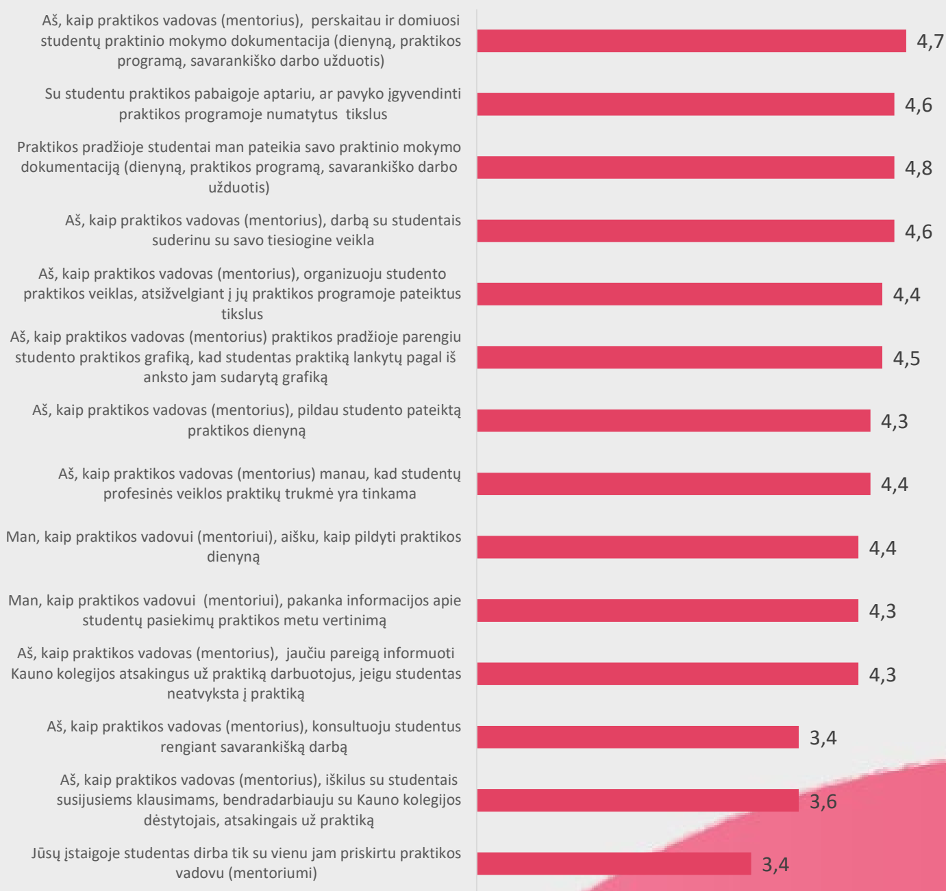
2 pav. Praktikos vadovų (mentorių) nuomonė apie praktikos organizavimą

Praktikos vadovų (mentorių) buvo prašoma įvertinti teiginius, susijusius su praktikos organizavimu. Gautų duomenų analizė atskleidė, jog labiausiai respondentai sutinka su teiginiu, jog jie, kaip praktikos vadovai (mentoriai), perskaito ir domisi studentų praktinio mokymo dokumentacija (dienynu, praktikos programa, savarankiško darbo užduotimi) (4,7) bei, jog su studentu praktikos pabaigoje aptaria, ar pavyko įgyvendinti praktikos programoje numatytus tikslus (4,6). Mažiausiai respondentai sutinka su teiginiu, jog jie kaip praktikos vadovai (mentoriai) iškilus su studentais susijusiems klausimams bendradarbiauja su Kauno kolegijos dėstytojais atsakingais už praktiką (3,6), bei jog studentas dirba tik su vienu jam priskirtu praktikos vadovu (mentoriumi) (3,4) bei konsultuoja studentus rengiant savarankišką darbą (3,4) (žr. 2 pav.).