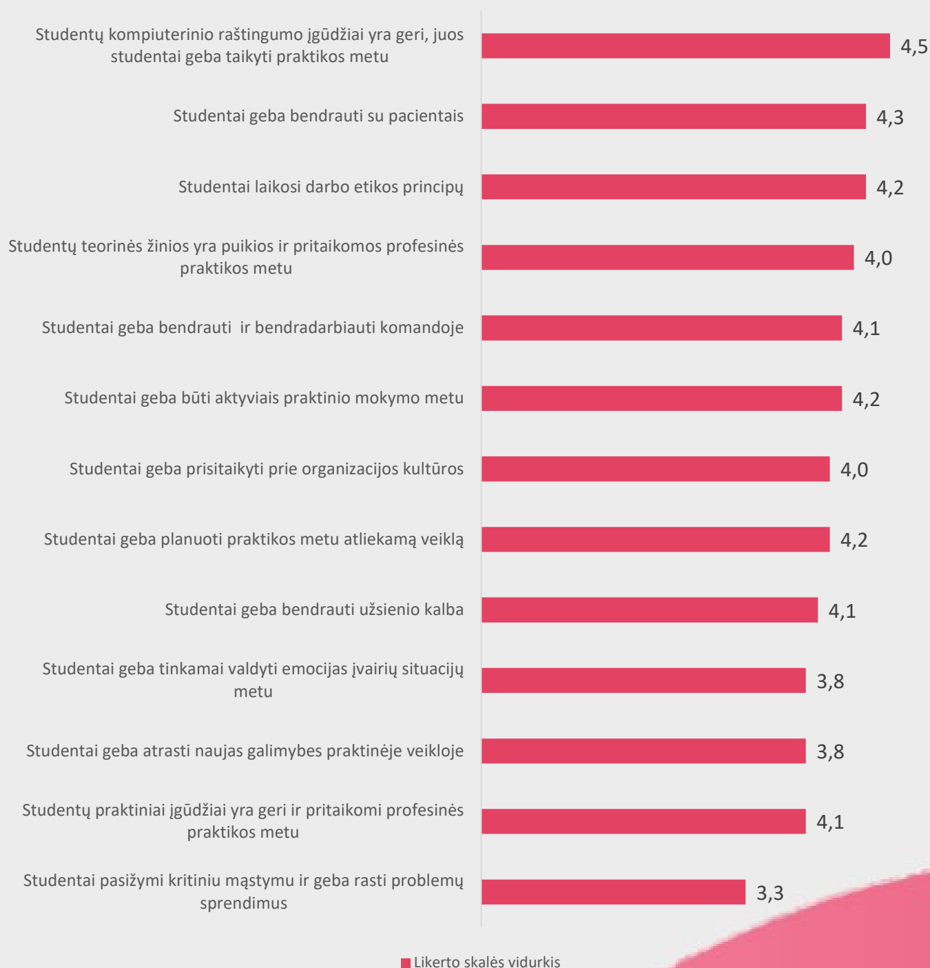
2 pav. Praktikos vadovų (mentorių) nuomonė apie studentų žinias ir gebėjimus

Praktikos vadovų (mentorių) buvo prašoma įvertinti teiginius susijusius su studentų žiniomis ir gebėjimais. Praktikos vadovai (mentoriai) labiausiai sutinka su teiginiu, jog studentų kompiuterinio raštingumo įgūdžiai yra geri, juos studentai geba pritaikyti praktikos metu (4,4) bei, kad studentai geba bendrauti su pacientais (4,2). Mažiausiai respondentai sutinka su teiginiu, jog studentų praktiniai įgūdžiai yra geri ir pritaikomi profesinės veiklos praktikos metu (3,7) bei, jog studentai pasižymi kritiniu mąstymu ir geba rasti problemų sprendimus.