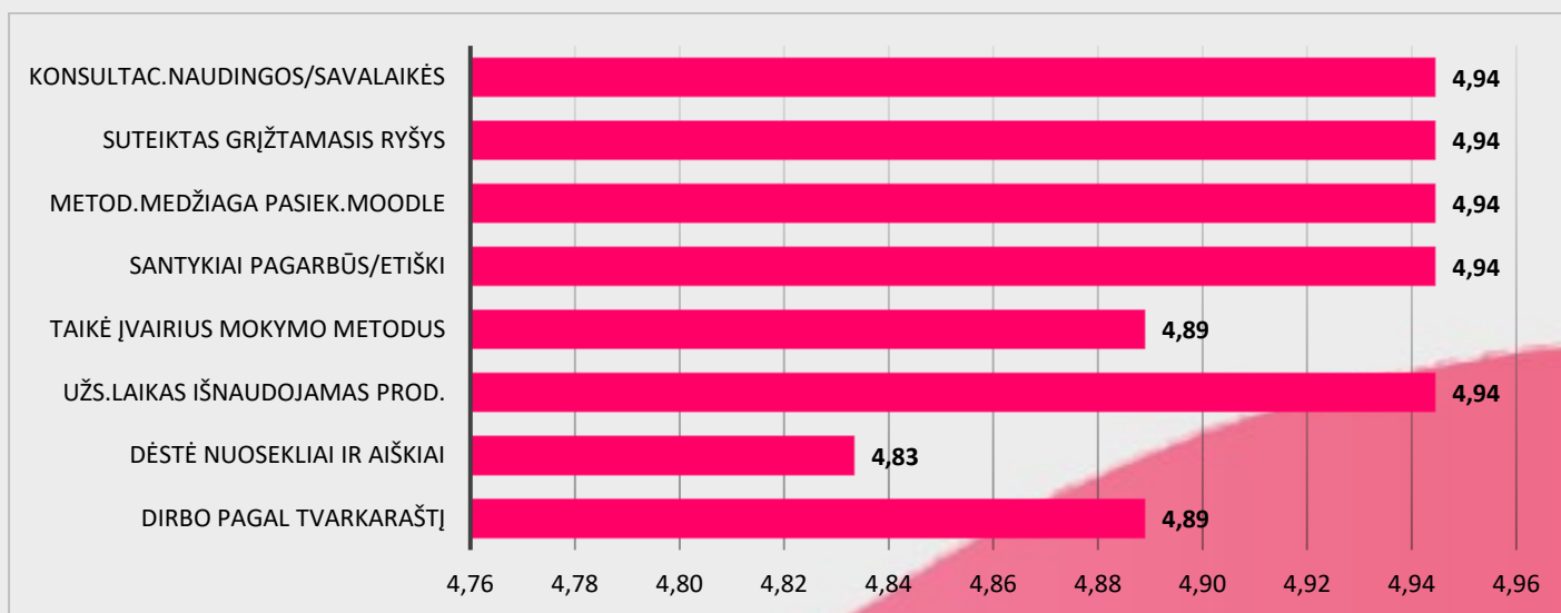
2 pav. Burnos higienos studijų programos dalykų dėstyto kokybės vertinimas pagal kriterijus (vidurkiai).

Burnos higienos studijų programos dalykų dėstyto kokybė pagal visus kriterijus vertinama labai aukštai (vidurkiai daugiau nei 4 balai iš 5) (žr. 2 pav.). Respondentai labiausiai sutinka su teiginiu, jog dėstytojas bendravo su studentais pagarbiai ir etiškai (4,94), pasiekama metodinė medžiaga Moodle sistemoje (4,94) ir suteiktas grįžtamas ryšis (4,94). Respondentai teigia, kad dėstytojas dirbo pagal tvarkaraštį (4,89). Respondentai sutinka su teiginiu, jog dėstytojo konsultacijos buvo naudingos ir savalaikės (4,94), dėstė nuosekliai ir aiškiai (4,83)