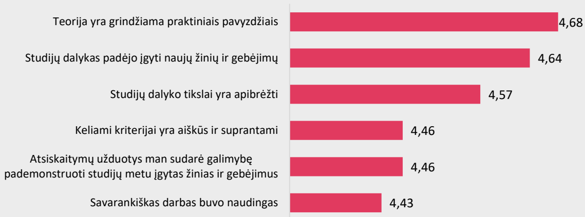
1 pav. Farmakoteknikos studijų programos dalykų turinio kokybės vertinimas pagal kriterijus (vidurkiai).

Pastaba: Pateiktas „Likerto“ skalės vidurkis. Kuo didesnis vidurkis, tuo respondentai labiau sutinka su pateiktu teiginiu