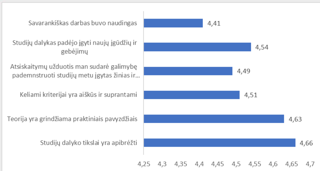
1 pav. Ergoterapijos studijų programos dalykų turinio kokybės vertinimas pagal kriterijus (vidurkiai).

Pastaba: Pateiktas „Likerto“ skalės vidurkis.