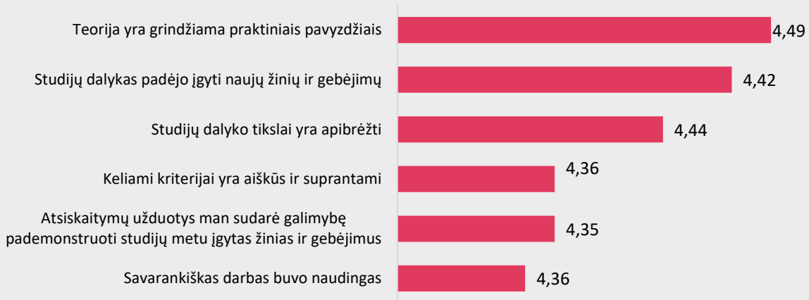
1 pav. Bendrosios praktikos slaugos studijų programos dalykų turinio kokybės vertinimas pagal kriterijus (vidurkiai).

Pastaba: Pateiktas „Likerto“ skalės vidurkis.