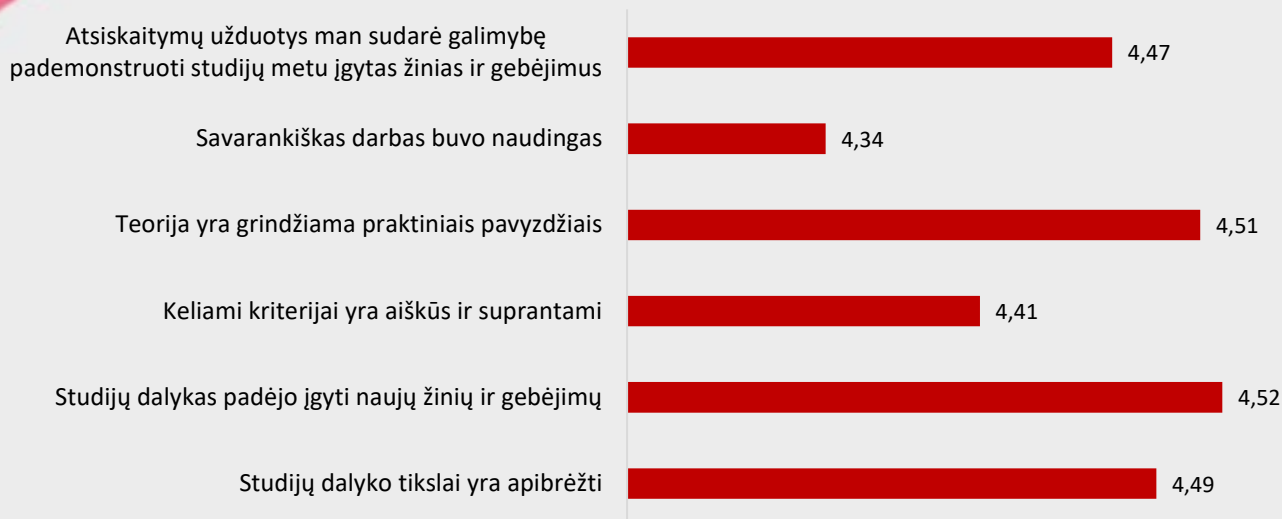
1 pav. Odontologinės priežiūros studijų programos dalykų turinio kokybės vertinimas pagal kriterijus (vidurkiai).

Pastaba: Pateiktas „Likerto“ skalės vidurkis.