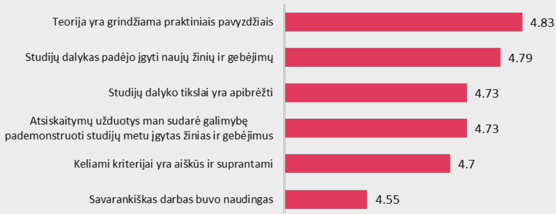
1 pav. Farmakoteknikos studijų programos dalykų turinio kokybės vertinimas pagal kriterijus (vidurkiai).

Pastaba: Pateiktas „Likerto“ skalės vidurkis. Kuo didesnis vidurkis, tuo respondantai labiau sutinka su pateiktu teiginiu