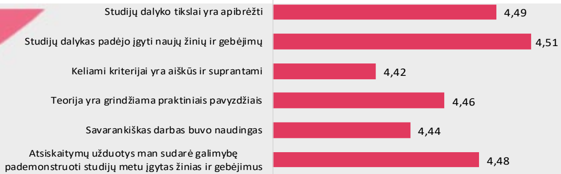
1 pav. Bendrosios praktikos slaugos studijų programos dalykų turinio kokybės vertinimas pagal kriterijus (vidurkiai).

Pastaba: Pateiktas „Likerto“ skalės vidurkis.