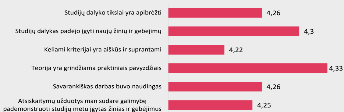
1 pav. Akušerijos studijų programos dalykų turinio kokybės vertinimas pagal kriterijus (vidurkiai).

Pastaba: Pateiktas „Likerto“ skalės vidurkis.