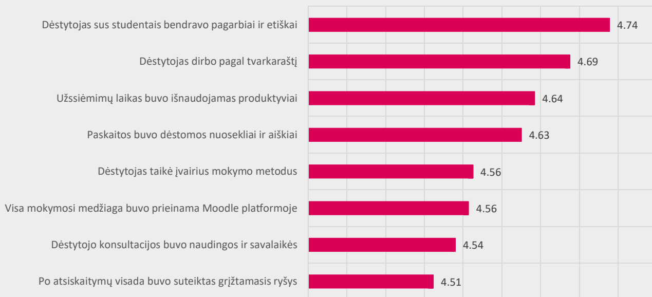
2 pav. Dietetikos studijų programos dalykų dėstyto kokybės vertinimas pagal kriterijus (vidurkiai), N=176

Dietetikos studijų programos dalykų dėstyto kokybė pagal visus kriterijus vertinama labai aukštai (vidurkiai daugiau nei 4 balai iš 5) (žr. 2 pav.). Respondentai labiausiai sutinka su teiginiais, jog dėstytojai bendravo su studentais pagarbiai ir etiškai (4,74) ir dirbo pagal tvarkaraštį (4,69) bei užsiėmimų laikas buvo išnaudojamas produktyviai (4,64). Mažiausiai respondentai sutinka su teiginiu, jog studentams po atsiskaitymų visada buvo suteiktas grįžtamasis ryšys (4,51).