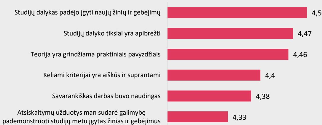
1 pav. Slaugos ir akušerijos studijų krypties dalykų turinio kokybės vertinimas pagal kriterijus (vidurkiai).

Pastaba: Pateiktas „Likerto“ skalės vidurkis.