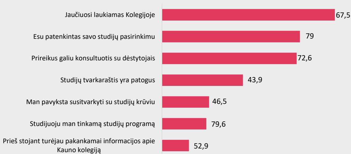
2 pav. Studijų patirties įvertinimas (proc.)

Didžioji dalis I-ojo kurso Medicinos fakulteto studentų yra patenkinti studijų pasirinkimu (79%) ir studijuoja tinkamą programą (79,6%), prireikus gali konsultuotis su dėstytojais (72,6%), jaučiasi laukiami kolegijoje (67,5%). (žr. 2 pav.).