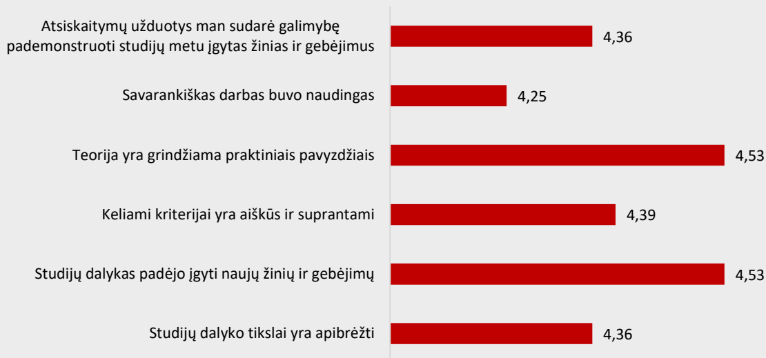
1 pav. Burnos higienos studijų programos dalykų turinio kokybės vertinimas pagal kriterijus (vidurkiai).

Pastaba: Pateiktas „Likerto“ skalės vidurkis.