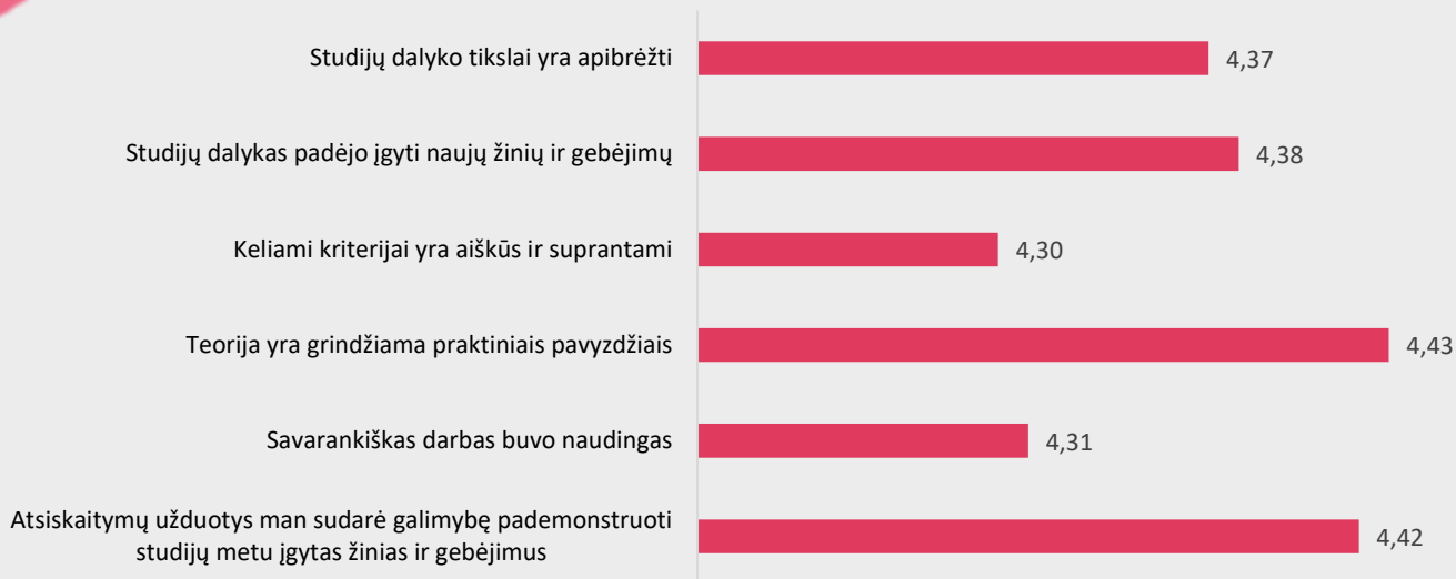
1 pav. Burnos higienos studijų programos dalykų turinio kokybės vertinimas pagal kriterijus (vidurkiai).

Pastaba: Pateiktas „Likerto“ skalės vidurkis.