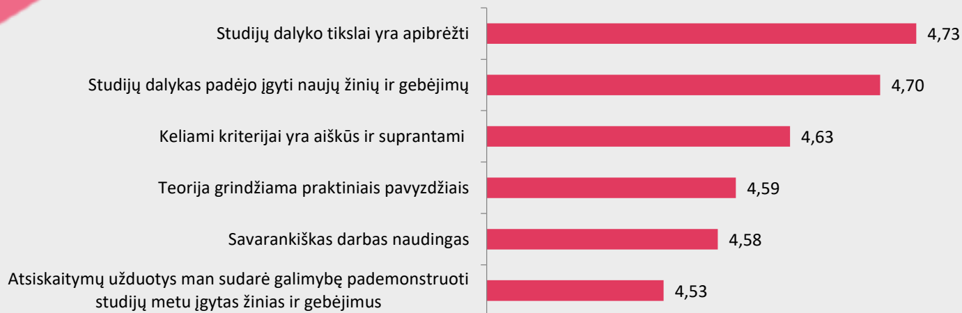
1 pav. Biomedicinos diagnostikos studijų programos dalykų turinio kokybės vertinimas pagal kriterijus

Pastaba: Pateiktas „Likerto“ skalės vidurkis.