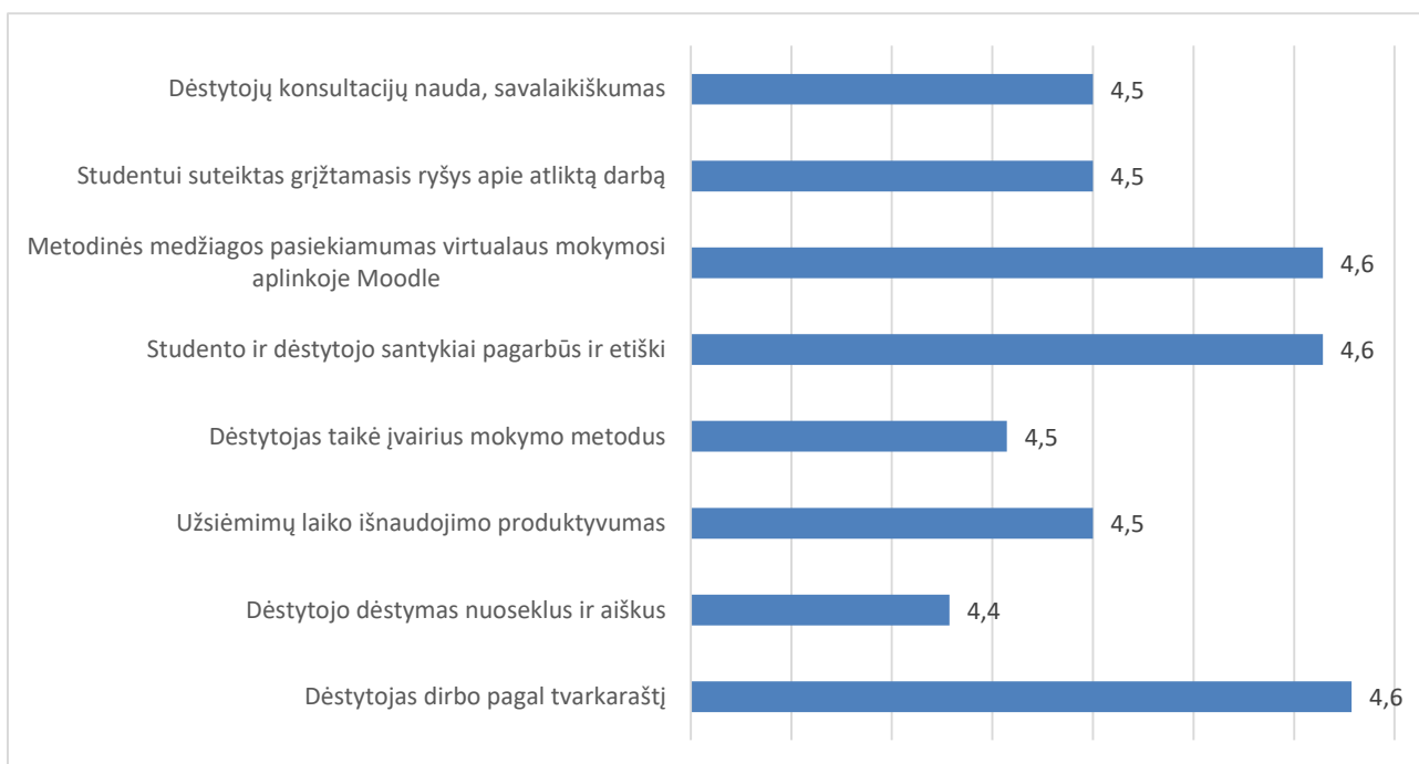
2 pav. Studijų programos Agroverslų technologijos dalykų dėstymo kokybės vertinimas pagal kriterijus (aritmetinis vidurkis)

Studijų programos Agroverslų technologijos dalykų dėstymo kokybės įvertinimų vidurkis yra 4,5 balo (žr. 2 pav.), t. y. aukštesnis nei 2022–2023 m. m. pavasario semestre (buvo 4,4 balo).