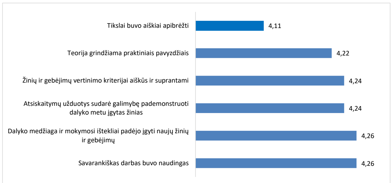
1 pav. Studijų programos Programų sistemos dalykų turinio kokybės vertinimas pagal šešis kriterijus (aritmetinis vidurkis)

Studijų programos Programų sistemos dalykų turinio kokybės įvertinimų vidurkis yra 4,22 balo (žr. 1 pav.), t. y. aukštesnis nei 2022–2023 m. m. pavasario semestru (buvo 4,11 balo).