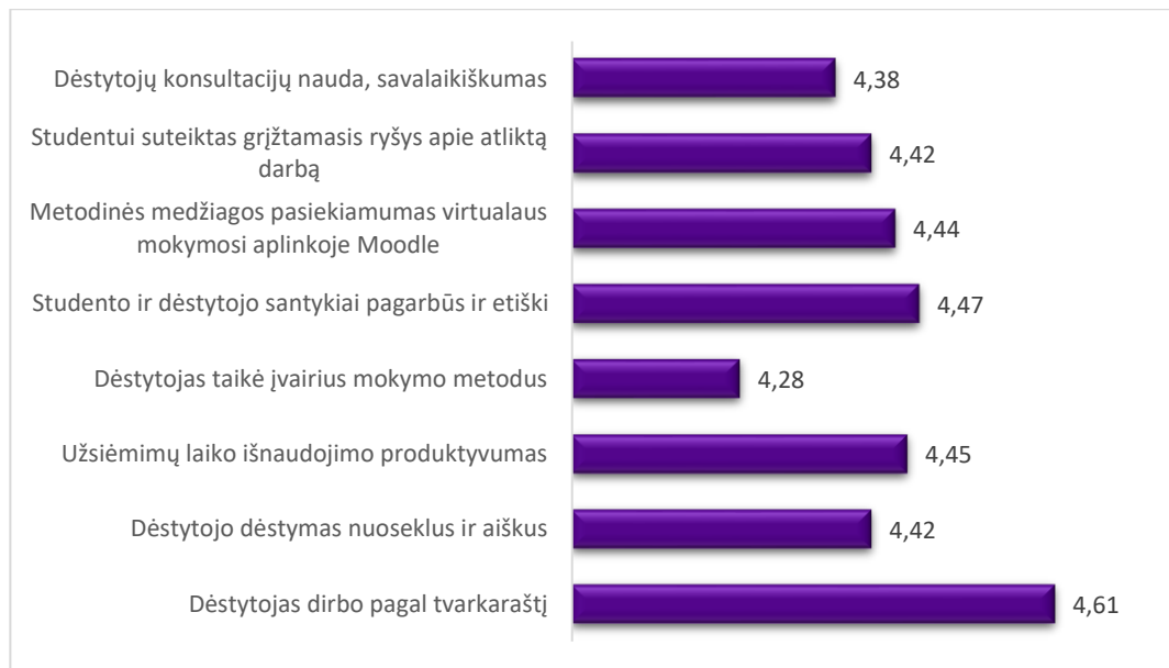
2 pav. Studijų programos Maisto technologija dalykų dėstymo kokybės vertinimas pagal aštuonis kriterijus (aritmetinis vidurkis)

Apibendrinant galima teigti, kad studentai gerai vertina 2025–2026 m. m. rudens semestro studijų dalykų turinį ir jų dėstymo kokybę. Bendras 2025–2026 m. m. rudens semestro studijų dalykų turinio ir kokybės įvertinimų vidurkis pagal visus kriterijus – 4,41 balo (2024-2025 m. m. rudens – 4,40 balo).