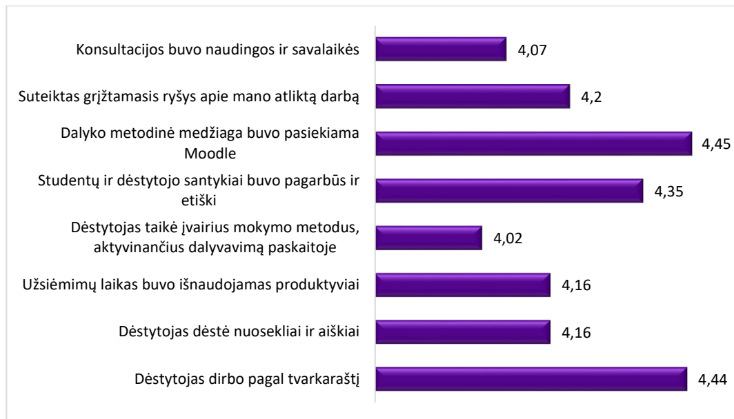
2 pav. Studijų programos Multimedijos technologija dalykų dėstyto kokybės vertinimas pagal kriterijus (aritmetinis vidurkis)

Apibendrinant galima teigti, kad studentai gerai vertina 2025–2026 m. m. rudens semestro studijų dalykų turinį ir jų dėstyto kokybę. Bendras 2025–2026 m. m. rudens semestro studijų dalykų turinio ir kokybės įvertinimų vidurkis pagal visus kriterijus – 4,16 balo (2024-2025 m. m. pavasario – 4,21 balo).