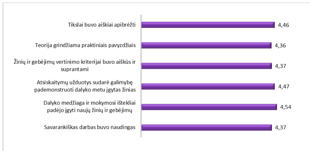
1 pav. Studijų programos Geodezija dalykų turinio kokybės vertinimas (aritmetinis vidurkis)

Geodezijos studijų programos dalykų turinio kokybės įvertinimų vidurkis yra 4,43 balai (žr. 1 pav.). 2024 – 2025 m. m. vertinimo vidurkis buvo 4,82 balai.