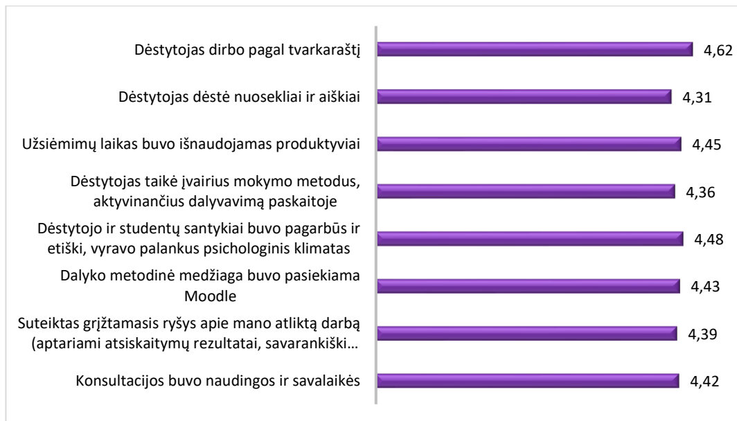
2 pav. Studijų programos Automatika ir robotika dalykų dėstytojų kokybės vertinimas (aritmetinis vidurkis)

Bendras studijų dalykų turinio ir dėstytojų kokybės įvertinimo pagal 14 kriterijų vidurkis yra 4,43 balai, 2024 - 2025 m. m. rudens semestro vertinimo vidurkis buvo 4,71 balai.