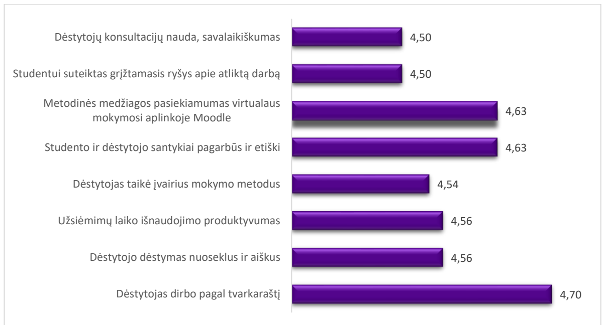
2 pav. Studijų programos Maisto technologija dalykų dėstymo kokybės vertinimas pagal aštuonis kriterijus (aritmetinis vidurkis)

Apibendrinant galima teigti, kad studentai gerai vertina 2024–2025 m. m. pavasario semestro studijų dalykų turinį ir jų dėstymo kokybę. Bendras 2024–2025 m. m. pavasario semestro studijų dalykų turinio ir kokybės įvertinimų vidurkis pagal visus kriterijus – 4,58 balo (2023-2024 m. m. pavasario – 4,49 balo).