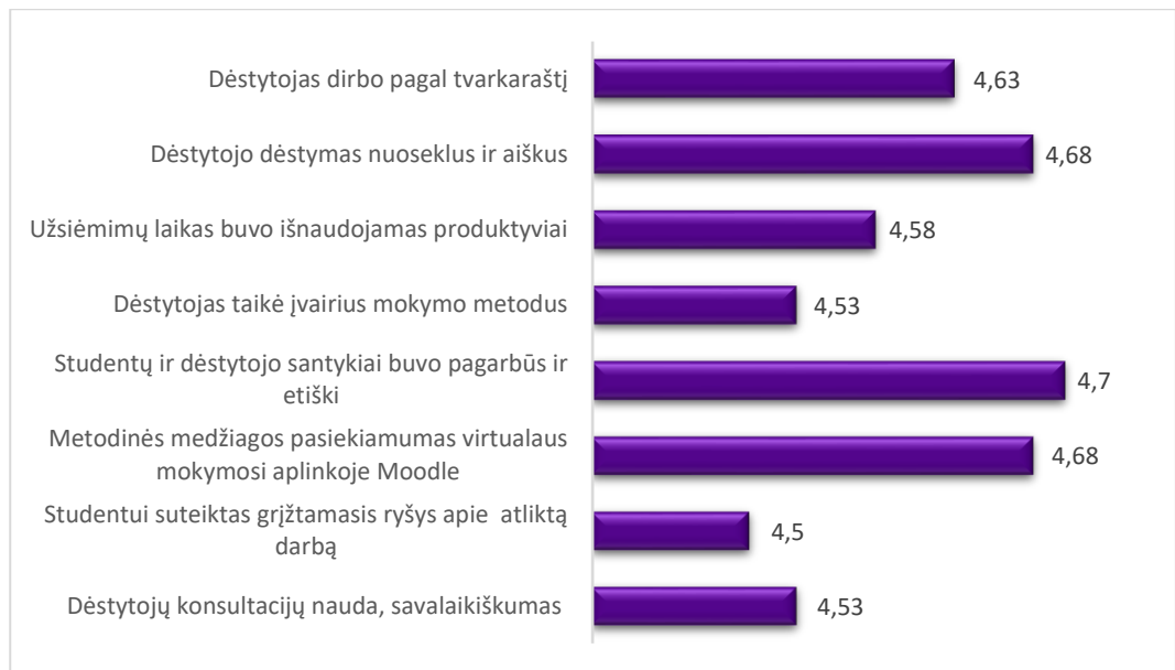
2 pav. Studijų programos Kibernetinės sistemos ir sauga dalykų dėstymo kokybės vertinimas pagal aštuonis kriterijus (aritmetinis vidurkis)

Apibendrinant galima teigti, kad studentai gerai vertina 2024–2025 m. m. rudens semestro studijų dalykų turinį ir jų dėstymo kokybę. Bendras 2024–2025 m. m. rudens semestro studijų dalykų turinio ir kokybės įvertinimų vidurkis pagal visus kriterijus – 4,59 balo (2023-2024 m. m. rudens - 4,35 balo)