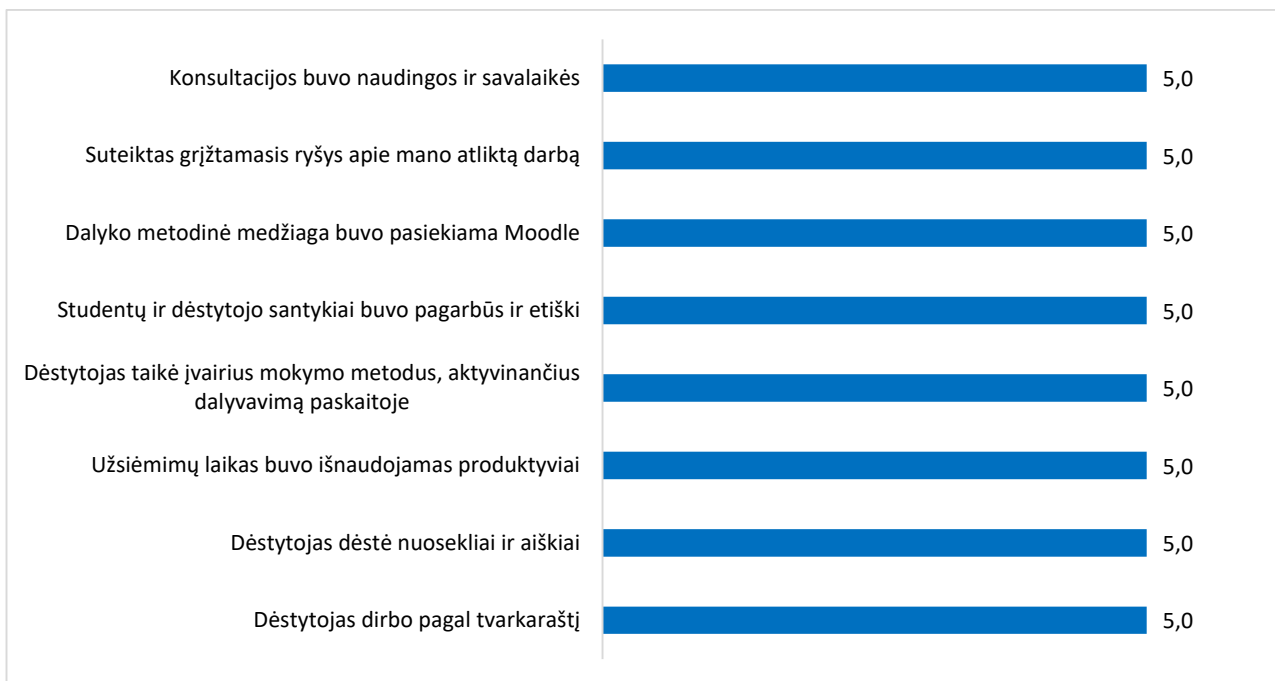
2 pav. Studijų programos Sistemų administravimas dalykų dėstyto kokybės vertinimas pagal aštuonis kriterijus (aritmetinis vidurkis)

Studijų programos Sistemų administravimas dalykų dėstyto kokybės įvertinimų vidurkis yra 5,0 balo (žr. 2 pav.). 2022–2023 m. m. rudens semestro studijų dalykų dėstyto įvertinimų vidurkis buvo 4,4 balo.